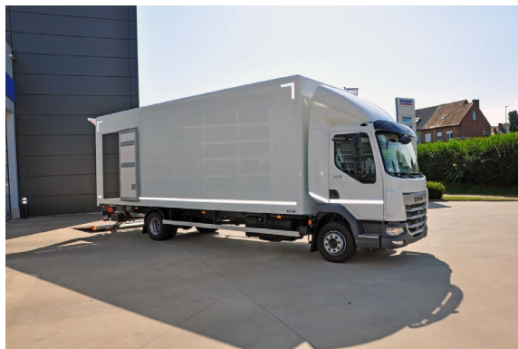
Garage H. Aerts

Blarenberglaan 2A 2800 Mechelen 015 28 60 50