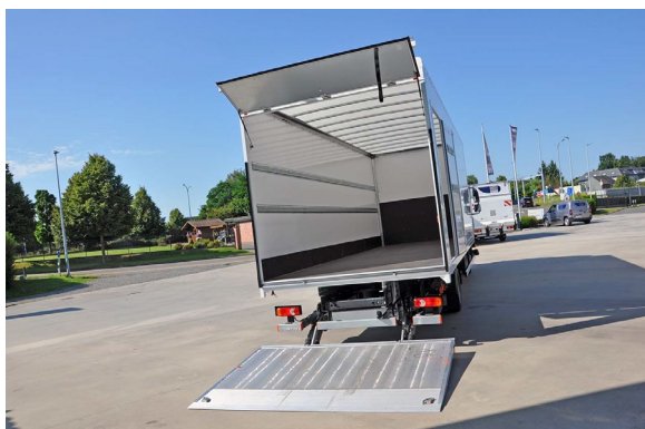
Garage H. Aerts

Contourmarkering lijn beneden + hoeken aan beide zijden (wit) en achteraan (rood).